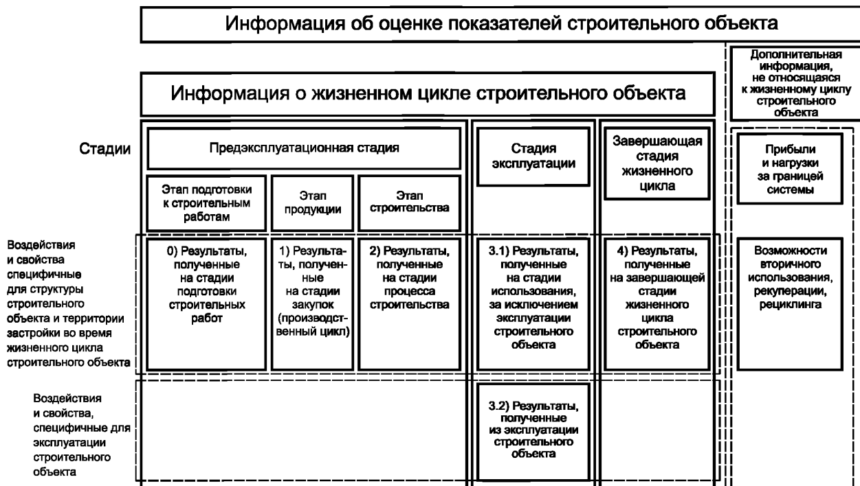
Рисунок 3 — Структура определения оценки в соответствии с этапами жизненного цикла и обязательными группами информации

Если при оценке учитывают дополнительные воздействия от приборов, не связанных со строительным объектом, как описано в 5.2, то это должно быть указано в отчете об оценке отдельно и без обобщения. Возможное объединение информационных групп, установленных в 5.8.2.2 и 5.8.2.3, должно быть четко отделено от результатов оценки и выделено как дополнительная информация. Объединение информационных групп, установленных в 5.8.2.2 и 5.8.2.3, может быть сделано только в том случае, если при определении оценки рассматривают весь жизненный цикл строительного объекта, не пренебрегая какими-либо его стадиями.