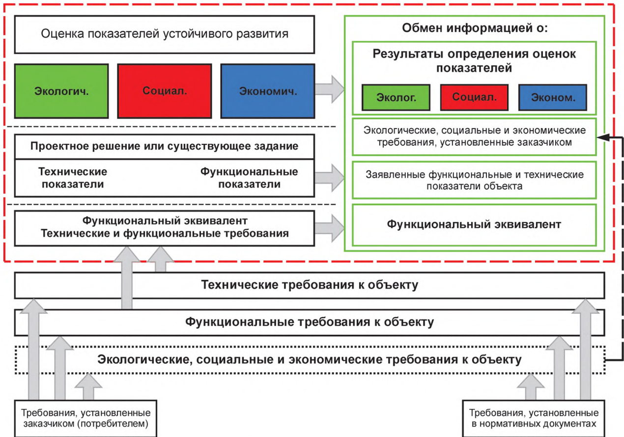
Рисунок 1 — Структура определения оценки показателей устойчивого развития строительного объекта