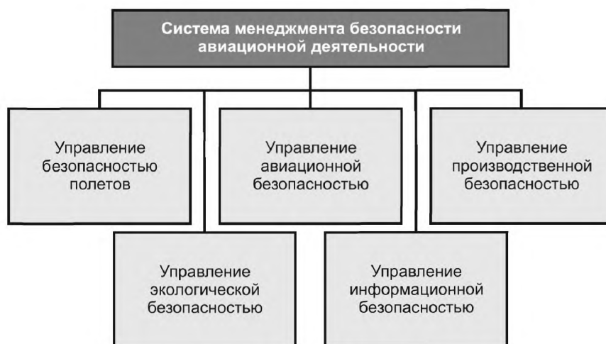
Рисунок 1 — Структура СМБАД