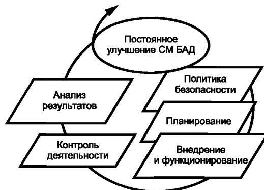
Рисунок 2 — Модель МБАД

Модель системы менеджмента безопасности авиационной деятельности представлена на рисунке 2 и основывается на цикле PDCA [Plan (планируй), Do (делай), Check (проверяй), Act (действуй)].