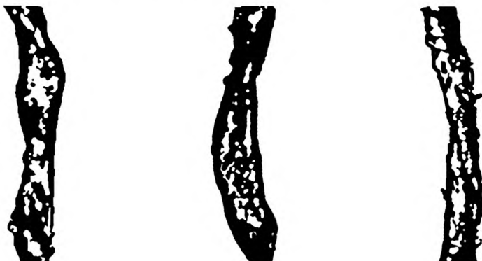
Рисунок Б.3 — Бактериально-грибковое заражение волокна средней степени (III группа)