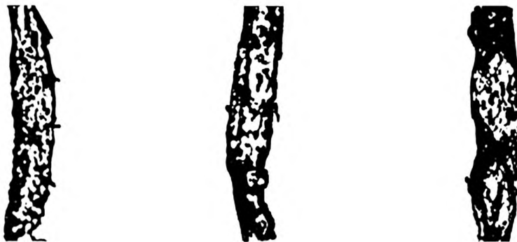
Рисунок Б.4 — Бактериально-грибковое заражение волокна сильной степени (IV группа)