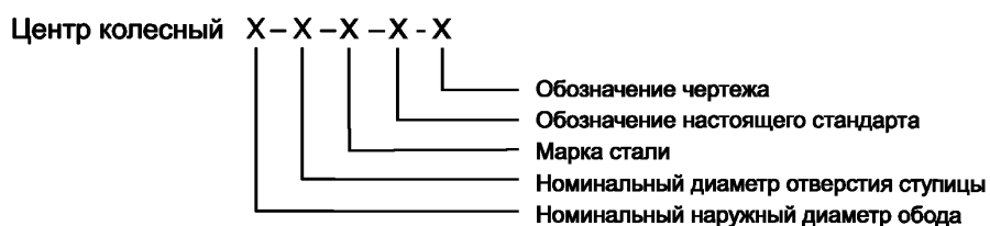
Рисунок 1 — Схема условного обозначения колесных центров

Схема условного обозначения колесных центров приведена на рисунке 1.