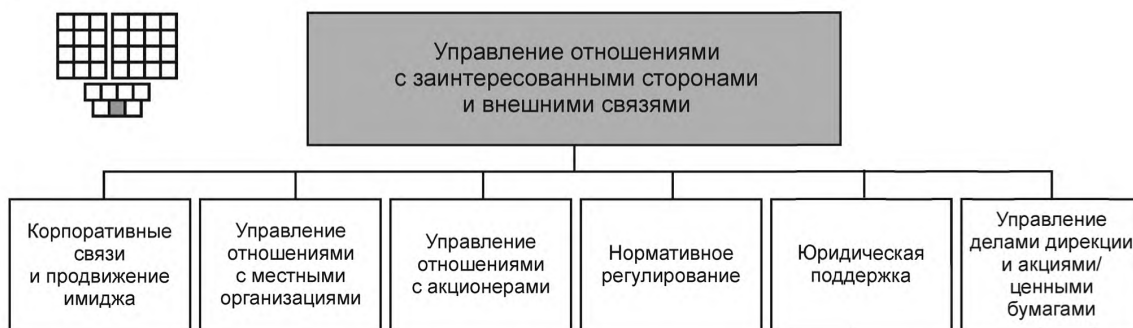
Рисунок 3 — Декомпозиция группы процессов «Управление отношениями с заинтересованными сторонами и внешними связями» на элементы процессов уровня 2

6.1 Структура группы процессов «Управление отношениями с заинтересованными сторонами и внешними связями» и соответствующие элементы процессов уровня 2 приведены на рисунке 3. На рисунке 3 представлена также пиктограмма, которая является общей для всех элементов процессов уровня 2.