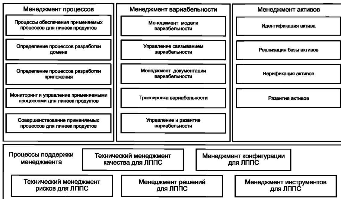
Рисунок 1 — Технический менеджмент линейки продуктов

Технический менеджмент линейки продуктов должен осуществляться по-разному для разработки домена и разработки приложений. Поскольку управленческие цели этих разработок отличаются друг от друга, то разными должны быть и процессы менеджмента для каждой из них. Кроме того, активы используются во всех приложениях, следовательно, приложения из линейки продуктов должны совместно использовать общие процессы для формирования приложений из активов.