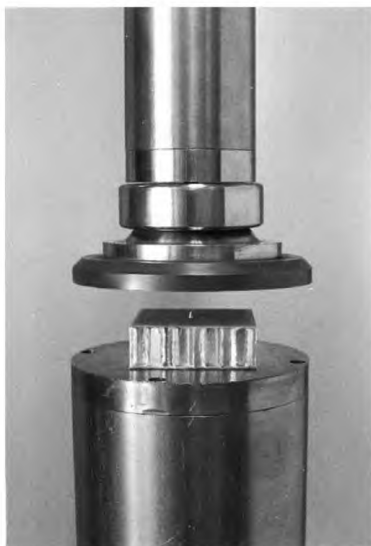
Рисунок 2 — Машина для испытания для определения механических характеристик при сжатии и устройство индикации смещения

П р и м е ч а н и е — Тензометры, жестко связанные с поверхностью исследуемого объекта, обычно считают непригодными для измерения деформации в данном случае из-за их жесткости. Армирующий эффект жесткой связи датчиков с некоторыми видами внутреннего слоя может привести к большим погрешностям в измерениях деформации.