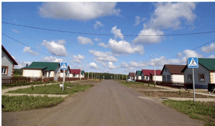
Комплексная застройка и благоустройство с. Калинино Александровского района Рязанской области

Рязанской области единовременного и ежемесячного пособий», предоставляется государственная услуга «Назначение единовременного и ежемесячного пособий молодым специалистам агропромышленного комплекса Рязанской области».