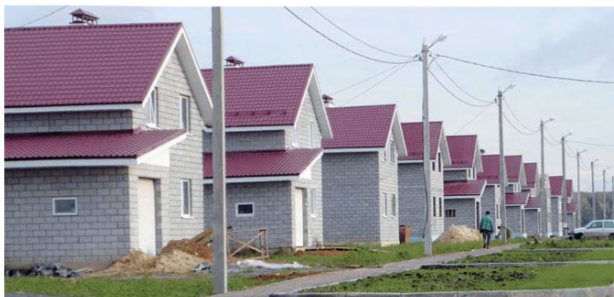
Проект комплексной застройки с. Шойбулак Медведевского района Республики Марий Эл