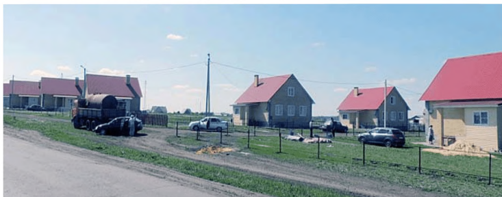
Комплексная застройка и благоустройство с. Новотроицкое Старошайговского района (Республика Мордовия)

Объем финансирования – 71,8 млн руб. Построены детский сад на 30 мест, инженерная инфраструктура.