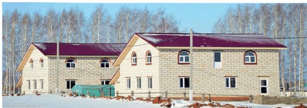
Проект комплексной застройки с. Староболтачево Болтаческого района Республики Башкортостан