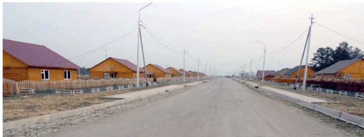
Комплексная застройка и благоустройство с. Ой Хангаласского улуса (Республика Саха (Якутия))

• микрорайон «Суорун Омоллоон» в с. Ытык-Кюель Таттинского улуса, объем жилищной застройки 47 индивидуальных жилых домов (построены проезды, сети электроснабжения и локального водоснабжения).