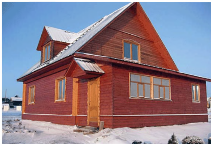
Дом молодой семьи разнорабочего ЗАО «Шекснинская сельхозхимия» Медведева Дмитрия Николаевича (Вологодская область, Шекснинский район, с. Чуровское)

В рамках федеральных целевых и государственных программ (подпрограмм) субъектов Российской Федерации, направленных на жилищное обустройство граждан, предоставляются социальные выплаты молодым семьям и молодым специалистам на строительство или приобретение жилья, предусмотрены льготные условия ипотечного жилищного кредитования, выделяются земельные участки для индивидуального жилищного строительства.