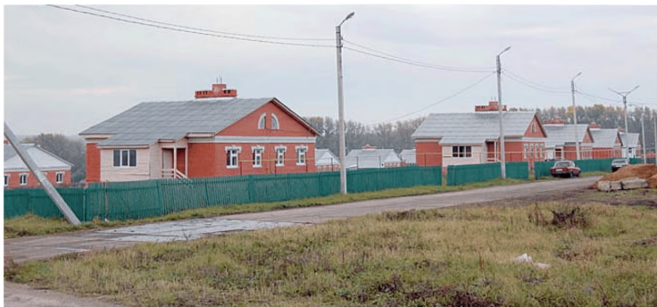
Комплексная застройка и благоустройство пос. Плодопитомнический Рузаевского района (Республика Мордовия)

С 2012 г. началась реализация проектов в Новотроицком сельском поселении Старошайговского муниципального района и Нововерхисском сельском поселении Инсарского муниципального района.