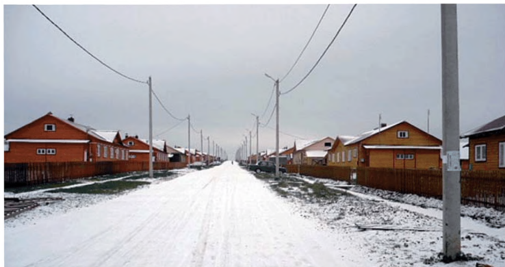
Комплексная застройка и благоустройство пос. Вичевщина Куменского района Кировской области

спортивной площадки; проложены инженерные сети, благоустроена территория.