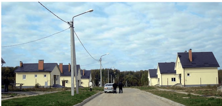
Комплексная застройка и благоустройство д. Новые Ляды Мосальского района Калужской области

Благодаря вышеперечисленным мерам ежегодно в сельскохозяйственные организации области в среднем трудоустраиваются около 80 выпускников аграрных образовательных организаций. В настоящее время в сельскохозяйственных организациях области трудятся более 400 молодых специалистов (в возрасте до 30 лет), которым оказывалась финансовая поддержка. В 2013 г. в сельскохозяйственные организации области трудоустроились еще 67 выпускников сельскохозяйственных учебных заведений, из них 51 – с высшим и средним профессиональным образованием.