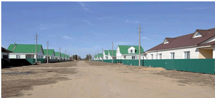
Комплексная застройка и благоустройство с. Ключи Ключевского района (Алтайский край)

• «Комплексная компактная застройка и благоустройство микрорайона с. Ключи Ключевского района Алтайского края» (первый этап строительства) – объектами строительства являются линии электропередач, водопровод, канализация, дороги, благоустройство, тепловая сеть, сети связи для обеспечения инженерной инфраструктурой микрорайона индивидуальной жилой застройки на 140 домов.