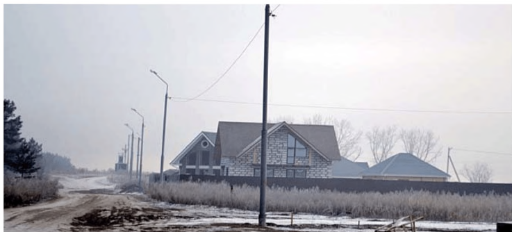
Комплексная застройка и благоустройство с. Селиваниха Минусинского района (Красноярский край)

обслуживания и объекты социальной инфраструктуры: детский сад на 90 мест, общеобразовательная школа на 250 учебных мест.