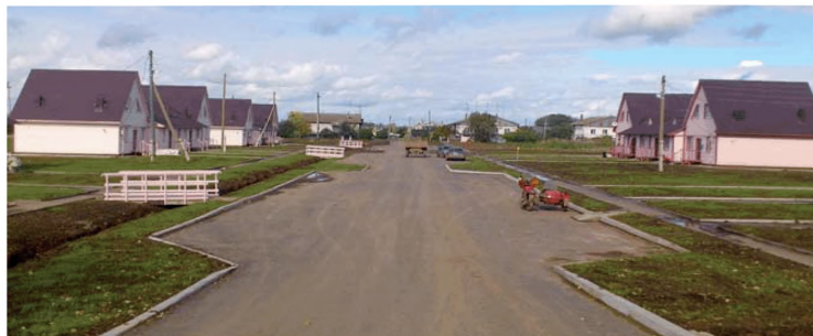
Комплексная застройка и благоустройство с. Каринка Кирово-Чепецкого района Кировской области

В рамках проекта комплексной компактной жилой застройки земельных участков в с. Каринка Кирово-Чепецкого района, начатого в 2010 г., возведено шесть домов по четыре квартиры общей площадью 1428,9 м 2 .