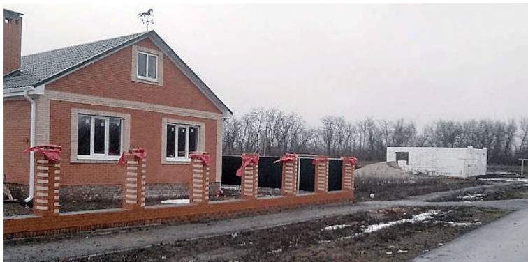
Комплексная застройка и благоустройство х.Чернышевка Зерноградского района Ростовской области

Согласно закону педагогическим, медицинским, социальным работникам, а также работникам культуры и ветеринарной службы предусмотрена компенсация расходов на оплату жилого помещения и коммунальных услуг в размере 100% оплаты за жилое помещение и коммунальные услуги.