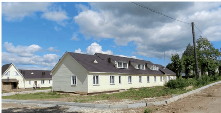
Комплексная застройка и благоустройство с. Филиппово Кирово-Чепецкого района Кировской области

В рамках проекта комплексной компактной жилой застройки земельных участков в с. Филиппово Кирово-Чепецкого района, начатого в 2010 г., возведены два дома по пять квартир общей площадью 659 м 2 . Объем финансовых вложений за три года реализации мероприятия (2010-2012 гг.) составил 41,8 млн руб., в том числе за счет средств федерального бюджета – 11,2 млн, консолидированного бюджета Кировской области – 25,5 млн, внебюджетных источников – 5,1 млн руб. Проведена реконструкция общеобразовательной школы на 275 мест, детского сада «Филиппок» на 110 мест, Филипповского сельского Дома культуры на 300 мест; построены детская и спортивная площадки; проведены инженерные сети, благоустроена территория.