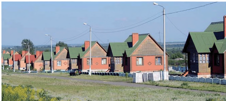
Комплексная застройка и благоустройство с. Новые Верхиссы Инсарского района (Республика Мордовия)

министрации поселения и фельдшерско-акушерского пункта, тренажерный зал с бытовым комплексом, зал для проведения торжественных мероприятий), соединенный переходом с действующей школой и спортивным залом. Проведено благоустройство территории. Объем финансирования составил 95 млн руб.