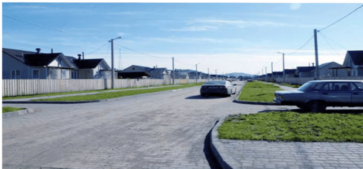
Комплексная застройка и благоустройство микрорайона «Алгаир-2» Майминского района (Республика Алтай)