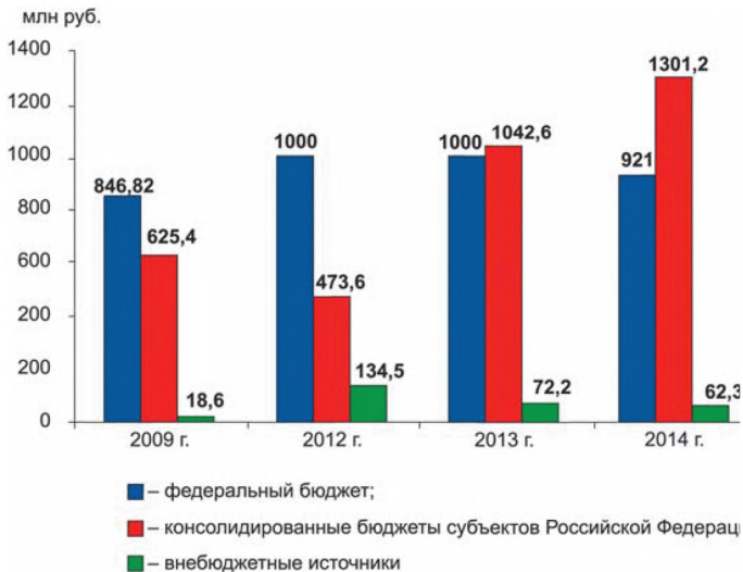
Рис. 2. Ресурсное обеспечение мероприятий по поддержке проектов комплексной застройки

В ряде субъектов Российской Федерации в целях создания современных сельских поселений реализуются проекты строительства агрогородков, в том числе на основе опыта Республики Беларусь (Ленинградская, Псковская области и другие регионы).