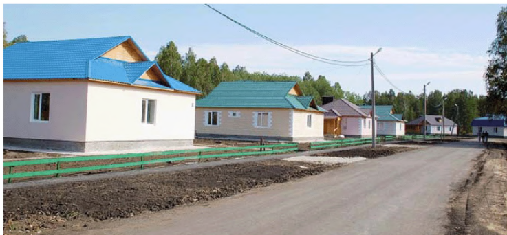
Комплексная застройка и благоустройство с. Чистoprудное Шадринского района Курганской области

В селе Восточное Частоозерского района Курганской области, наряду со строительством жилого микрорайона были реконструированы объекты социальной инфраструктуры – детский сад и Дом культуры.