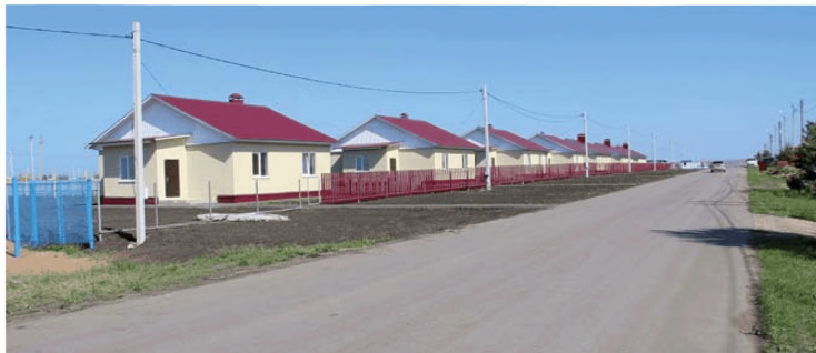
Комплексная застройка и благоустройство пос. Сургут Сергиевского района Самарской области

Планируется строительство молочно-товарной фермы на 400 коров в ООО «АгроИнвест» и на 200 коров в ООО «Савия».