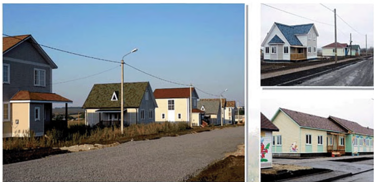
Проект комплексной застройки с. Мантурово Курской области

В ряде субъектов Российской Федерации в целях создания современных сельских поселений реализуются проекты строительства агрогородков, в том числе на основе опыта Республики Беларусь (Ленинградская, Псковская области и другие регионы).