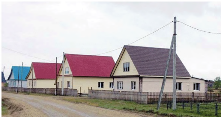
Комплексная застройка и благоустройство с. Восточное Частоозерского района Курганской области