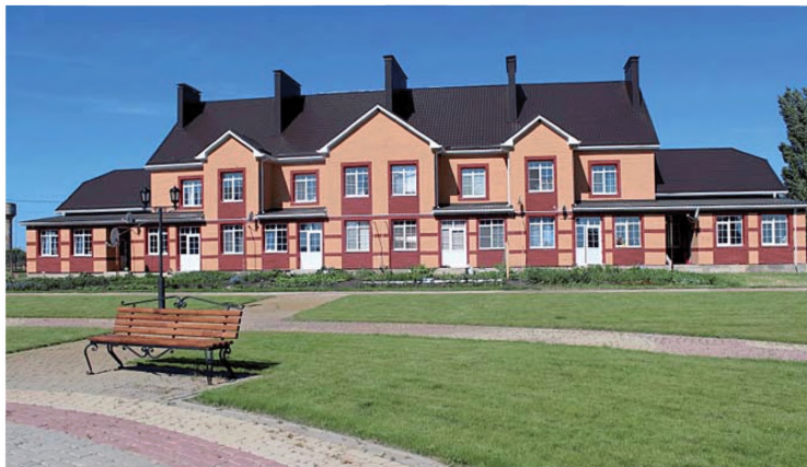
Комплексная застройка и благоустройство с. Верхняя Хава Верхнехавского района Воронежской области

Для привлечения квалифицированных кадров в сельскохозяйственную отрасль Верхнехавского муниципального района и в целях реализации мероприятий программы «Социальное развитие села до 2013 года» ОАО «Верхнехавский элеватор» выступил инициатором комплексной компактной застройки жилой зоны по ул. Советская в с. Верхняя Хава в рамках пилотного проекта.