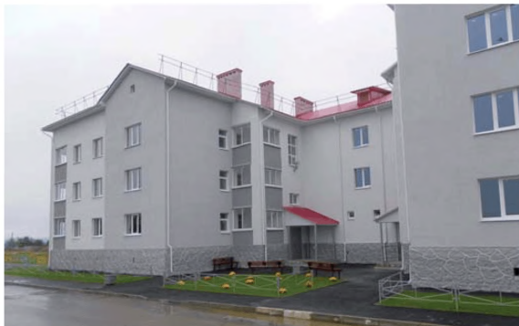
Комплексная застройка и благоустройство пос. Плодовое Приозерского района Ленинградской области

ников агропромышленного комплекса Ленинградской области», в соответствии с которым право на получение выплаты в размере 91,954 тыс. руб. имеет молодой специалист – гражданин Российской Федерации в возрасте до 30 лет, имеющий документ государственного образца о среднем профессиональном или высшем профессиональном образовании (по специальностям: агрономия, зоотехния, инженерия, ветеринария), выданный ему после 1 января 2008 г., и впервые заключивший трудовой договор с предприятием агропромышленного комплекса на неопределенный срок.