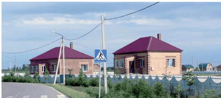
Комплексная застройка и благоустройство с. Ивановка Ивановского района Амурской области

В 2012 г. реализован проект строительства второй очереди комплексной компактной застройки и благоустройства: проведены линии электропередач ВЛ-0,4 кВт и ВЛ-10 кВт, построены трансформаторная подстанция, автомобильные дороги с твердым покрытием, выполнено наружное освещение, благоустройство и озеленение участка. Кроме того, в 2012 г. с использованием средств субсидий в рамках ФЦП «Социальное развитие села до 2013 года» возведено 19 жилых домов общей площадью 1230,2 м 2 .