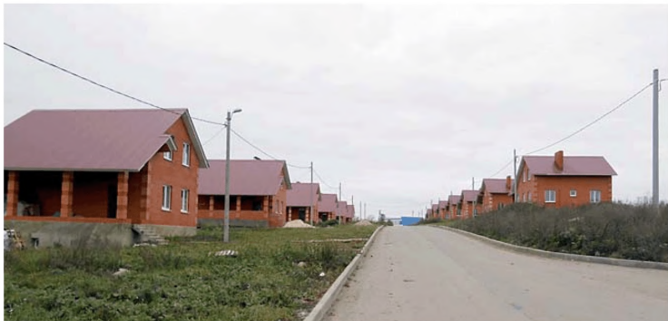
Комплексная застройка и благоустройство с. Дедилово Киреевского района Тульской области

На территории с. Дедилово Дедиловского сельского поселения выделен участок под строительство 55 жилых домов. С привлечением средств бюджетов всех уровней участок обеспечен современной инженерной инфраструктурой, завершено строительство фельдшерско-акушерского пункта, проведена реконструкция столовой школы с переходом, построены детский сад и физкультурно-оздоровительный комплекс (ФОК), установлены очистные сооружения блочного типа.