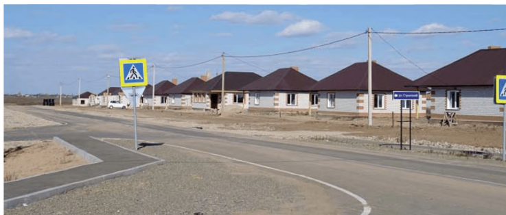
Комплексная застройка и благоустройство с. Волково Благовещенского района Амурской области

Построены линии электропередачи на 6,4 км, трансформаторная подстанция, улично-дорожная сеть и транспортные проезды (0,996 км), благоустроено 689 м 2 территорий.