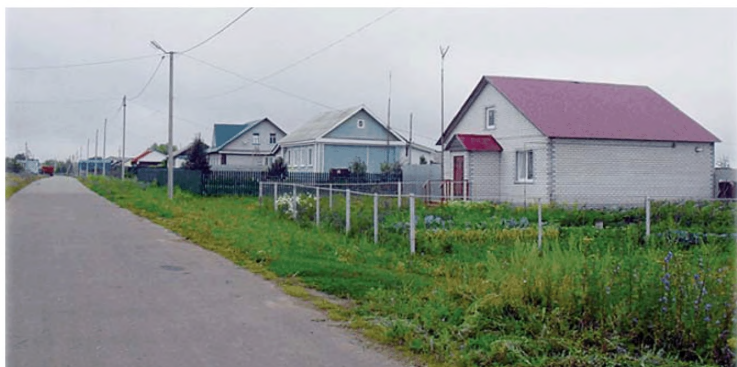
Комплексная застройка и благоустройство с. Мордовская Козловка Атюрьевского района (Республика Мордовия)

• по первой категории с объемом жилищной застройки от 10 до 20 домов – «Строительство улицы с жилым сектором на 19 домов в Мордовско-Козловском сельском поселении Атюрьевского муниципального района Республики Мордовия». По данному проекту было освоено 60 млн руб., в том числе 44 млн за счет средств федерального бюджета. В рамках проекта построены: социальный центр, включающий в себя сельский клуб, детский сад, ФАП, библиотеку, почту, администрацию, магазин, спортивную площадку; проведено благоустройство села – оно обеспечено инженерными коммуникациями;