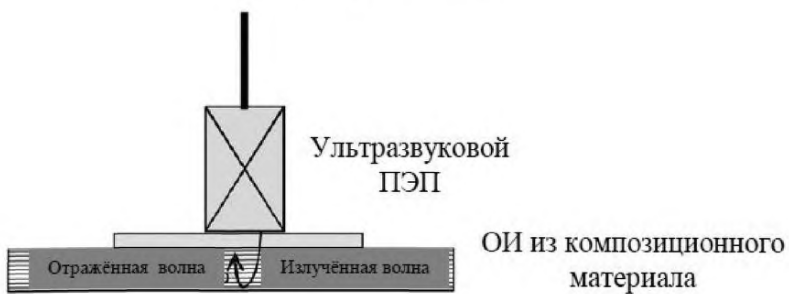
Рисунок 2 — Метод А. Ручной ультразвуковой эхо-импульсный метод