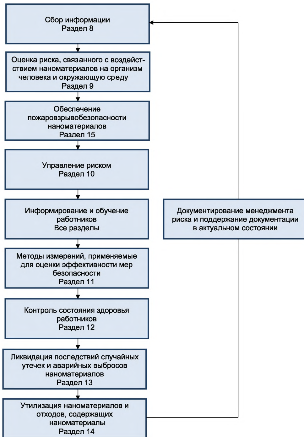
Рисунок 1 — Структура менеджмента риска, связанного с воздействием наноматериалов на организм человека и окружающую среду