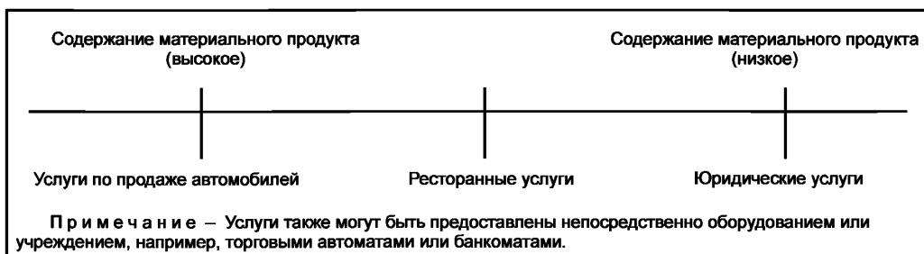
Рисунок 1 — Содержание продукта в спектре услуг

Рисунок 1 демонстрирует данную модель на примере трех типов услуг.