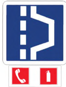
Рисунок Б.4 — Площадка для аварийной остановки

отдельной табличкой типа 8.1.1. по ГОСТ Р 52290, приложение А. Размер знака должен соответствовать размерам квадратных информационных знаков по ГОСТ Р 52290, таблица Д.5 приложения Д. Технические требования к знаку по ГОСТ Р 52290 в части информационных знаков. Изображение знака на масштабной сетке в соответствии с рисунком Б.4а.