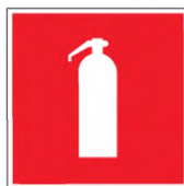
Рисунок Б.2 — Огнетушитель

На аварийных постах, отделенных от тоннеля дверью, должна присутствовать хорошо различимая надпись на русском и на английском языках: