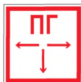
Рисунок Б.3 — Пожарный гидрант

Знак F09 по ГОСТ Р 12.4.026, обозначающий пожарный гидрант, должен указывать место расположения пожарного гидранта (см. рисунок Б.3).