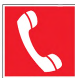
Рисунок Б.1 — Телефон аварийной связи

Аварийные посты должны быть оснащены знаками пожарной безопасности F.04 и F.05 по ГОСТ Р 12.4.026, приложение М, и указывать на соответствующее оборудование, предназначенное для пользователей тоннеля (см. рисунки Б.1 и Б.2).