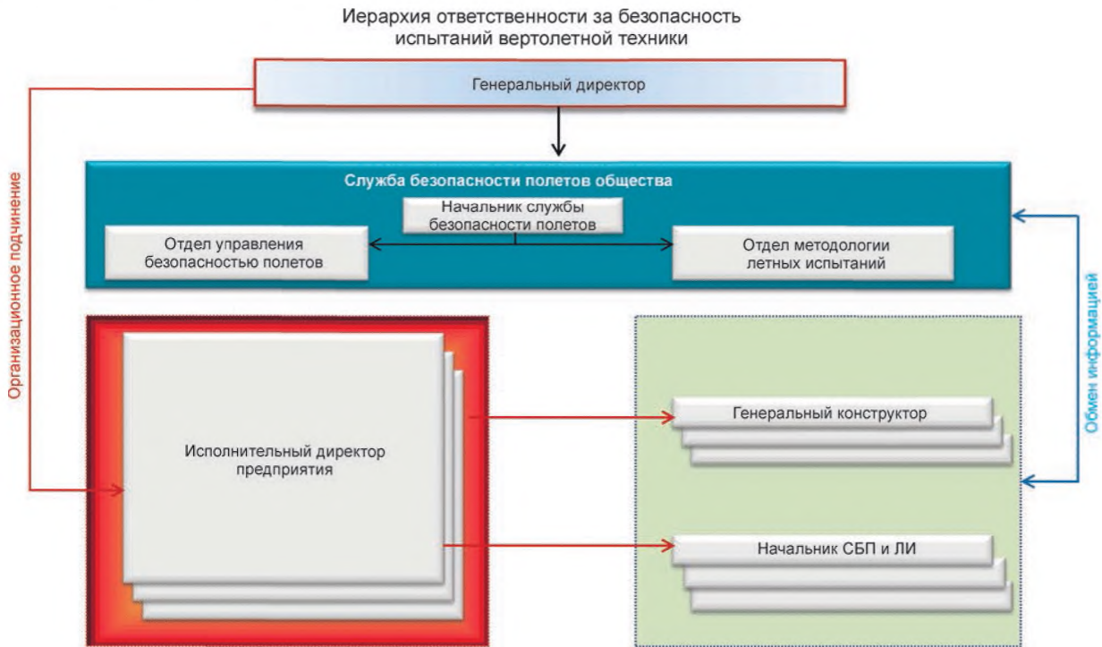
Рисунок 1 — Иерархия ответственности за безопасность испытаний вертолетной техники

Представленная схема предусматривает сбалансированное распределение обязанностей и ответственности между руководством, предприятиями, ответственными руководителями структурных подразделений и сотрудниками по вопросам обеспечения безопасности полетов.