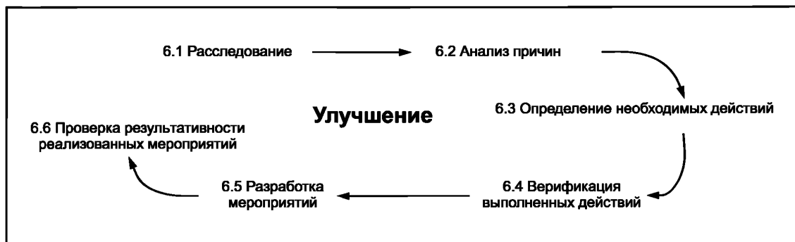
Рисунок 3 — Этап III. Улучшение

Практика показывает, что документально план должен быть разработан до начала проведения расследования (см. приложение D). План должен включать: