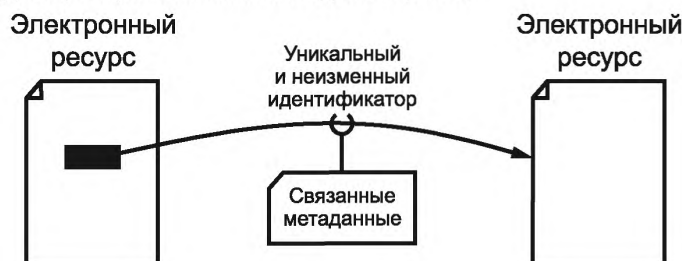
Рисунок 1 — Использование уникальных PID для указания пути от исходного ресурса к целевому