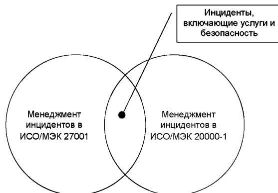
Рисунок 3 — Иллюстрация взаимосвязи между стандартами, касающаяся менеджмента инцидентов

На рисунке 3 показана взаимосвязь между менеджментом инцидентов информационной безопасности в ИСО/МЭК 27001 и менеджментом инцидентов в ИСО/МЭК 20000-1.