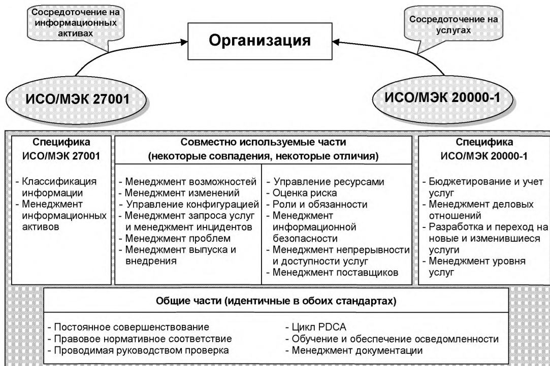
Рисунок 1 — Сравнение концепций ИСО/МЭК 27001 и ИСО/МЭК 20000-1

Менеджмент услуг и менеджмент информационной безопасности часто рассматривают так, будто они не связаны и даже не зависят один от другого. Условием такого разделения является то, что менеджмент услуг, бесспорно, может иметь отношение к эффективности и рентабельности, тогда как менеджмент информационной безопасности часто не рассматривается как основа для эффективного оказания услуг. В результате менеджмент услуг часто реализуется в первую очередь. Однако, как показано на рисунке 1, многие цели управления, а также меры и средства контроля и управления из приложения А ИСО/МЭК 27001:2005, также включены в требования менеджмента услуг из ИСО/МЭК 20000-1.