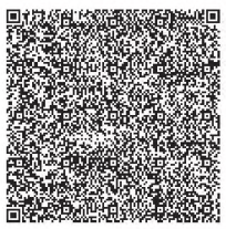
Рисунок 5 — Пример изображения двумерного символа штрихового кода с графическим маркером стандарта

Пример изображения двумерного символа штрихового кода с графическим маркером стандарта приведен на рисунке 5.