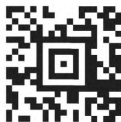
Рисунок 2 — Символ Aztec Code

Пример символа Aztec Code приведен на рисунке 2.