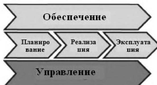
Рисунок 2 – Основные компоненты бизнес-процессов в ИКТ

2. Бизнес-процессы в ИКТ имеют основные компоненты: планирование, реализация, эксплуатация, обеспечение, управление. Этапы реализации и эксплуатации являются основными, этапы обеспечения и управления пронизывают их, связывая между собой. Этапы планирования и обеспечения являются стратегическими этапами для компаний, которые предлагают и разрабатывают решения, конфигурируют и разрабатывают продукты, сервисы, виды деятельности и правила. Этапы реализации и эксплуатации сопровождают ежедневную деятельность по управлению и улучшению бизнеса.