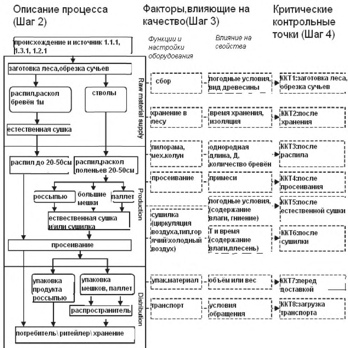
Схема 2 – Пример описания процесса производства и цепочки доставки для бревён L100 с факторами, влияющими на качество, и критическими контрольными точками

Пример 1: Производитель дров сам транспортирует древесину из леса, распиливает и колет её на бревна L100 и пакует по 1м 3 в рабочем состоянии. Производитель хранит её для естественной сушки на чистой и твёрдой почве, защищённой от дождя. После 12 месяцев естественной сушки L100 бревна распиливаются по заказу клиента на L20, L25, L33 или L50, просеиваются при загрузке и доставляются производителем потребителю. Доставленный объём считается по рабочему состоянию топлива. Может быть рассчитан объём продукта, прошедшего естественную сушку.