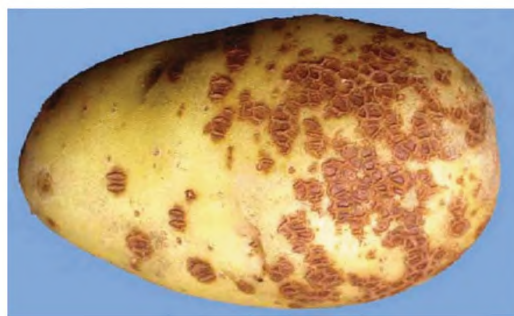
Рисунок 2 — Парша сетчатая [3] (поражено 33,3 % поверхности клубня)