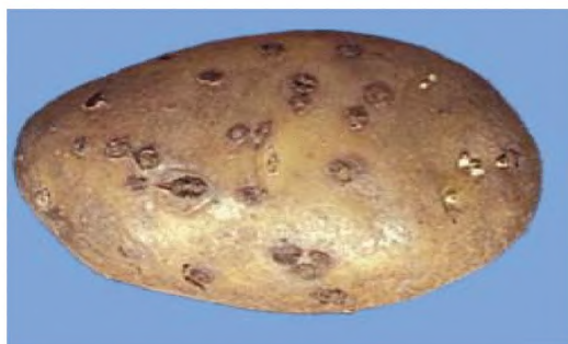
Рисунок 3 — Парша порошистая [3] (поражено 10 % поверхности клубня)