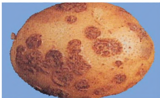
Рисунок 1 — Парша обыкновенная [3] (поражено 33,3 % поверхности клубня)

6.5.2 Определение площади пораженной поверхности клубня паршой (обыкновенная, сетчатая, порошистая) и ризоктонией — по [3]. Клубень считается пораженным болезнью, если площадь пораженной поверхности паршой обыкновенной превышает 33,3 % или более \frac{1}{3} поверхности (см. рисунок 1), паршой сетчатой — 33,3 % (см. рисунок 2), паршой порошистой — 10 % (см. рисунок 3), ризоктонией — 10 % (см. рисунок 4).