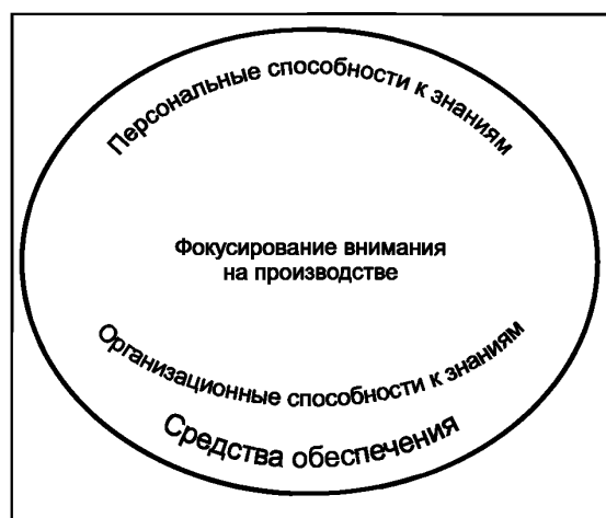
Рисунок 1 — Основа менеджмента знаний

3 Средства обеспечения представляют собой третий компонент и включают две основные дополняющие друг друга категории, называемые персональными и организационными способностями к знаниям. Эти способности следует рассматривать как средства обеспечения деятельности в отношении знаний.