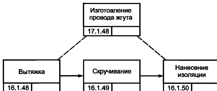
Рисунок В.5 — Процесс изготовления провода жгута

Отсутствуют внешние события, необходимые или запрещенные по отношению к действию «make_harness». Следовательно, оно является несвязанным.