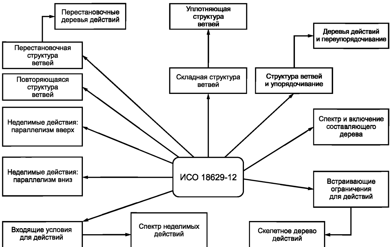
Рисунок 1 — Дефиниционные расширения ИСО 18629-41

Примечание — Полную диаграмму взаимозависимости между расширениями ИСО 18629-12 см. в ИСО 18629-12:2005 (подраздел 5.1).