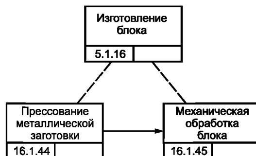
Рисунок В.3 — Процесс изготовления блока изделия GT-350

Блок изделия GT-350 выполняется как агрегат для сборки двигателя изделия GT-350. Изготовление блока требует выполнения всех технологических операций, начиная от литья заготовки и ее механической обработки (см. рисунок В.3).