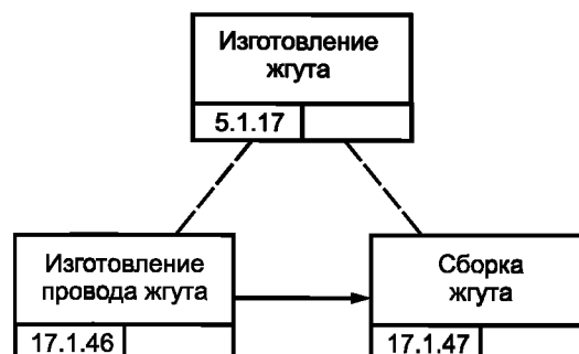
Рисунок В.4 — Процесс изготовления жгута изделия GT-350

Жгут изделия GT-350 (см. рисунок В.4) изготавливают как сборочный агрегат двигателя изделия GT-350. Данный технологический процесс организован в цехе кабелей и проводов. Рисунок В.5 представляет процесс изготовления провода жгута. Жгут изделия GT-350 собирают на особом стенде из проводов и кабелей. Сборка одного жгута требует 10 мин.