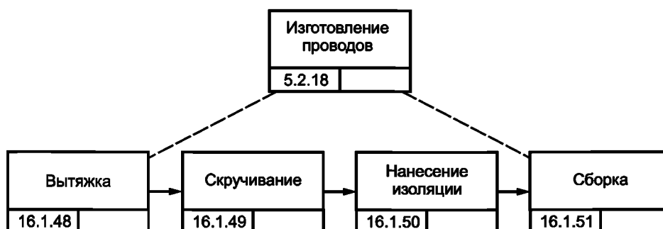
Рисунок В.6 — Процесс изготовления проводов изделия GT-350

Ниже дано представление некоторых действий и соответствующих технологических данных на языке программирования PSL: