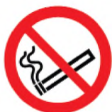
ИСО 7010-P002 Не курить! (запрещение)