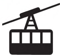
ИСО 7001-0033 Канатная подвесная дорога с большими кабинами (информация для публики)