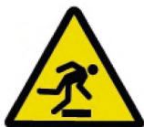
ИСО 7010-W007 Предупреждение, препятствия (предупреждение)