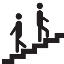
ИСО 7001-0011 Лестница (информация для публики)