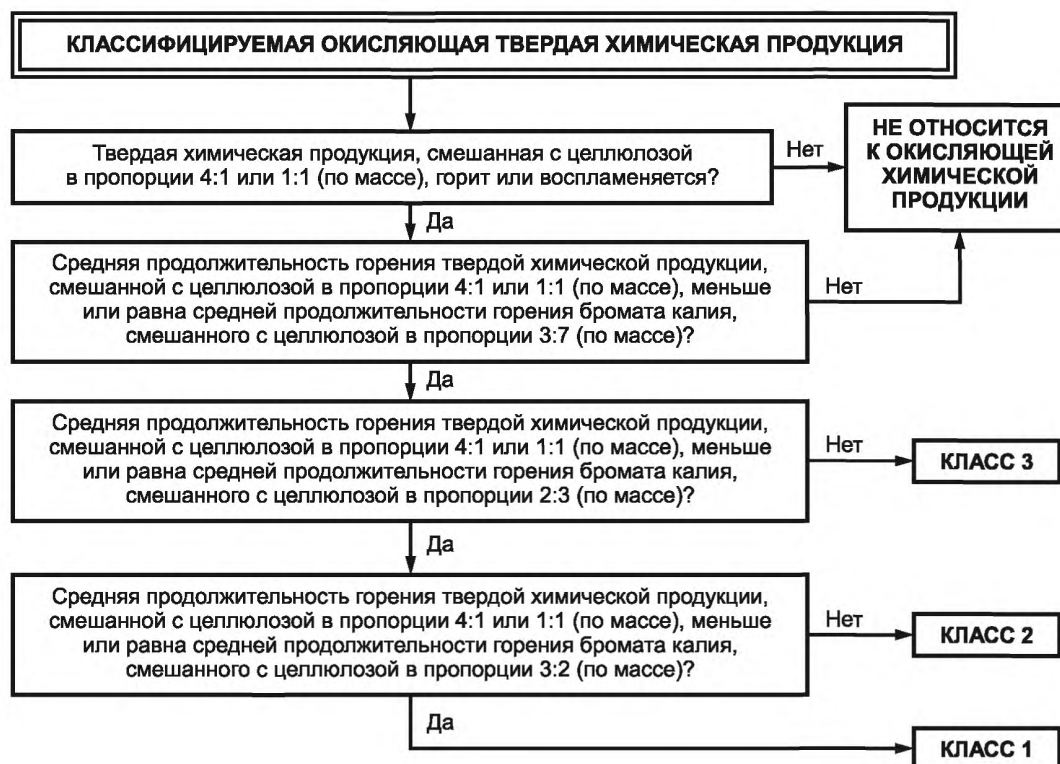
Рисунок 1 — Процедура классификации окисляющей твердой химической продукции

Процедура классификации опасности окисляющей твердой химической продукции представлена на рисунке 1.