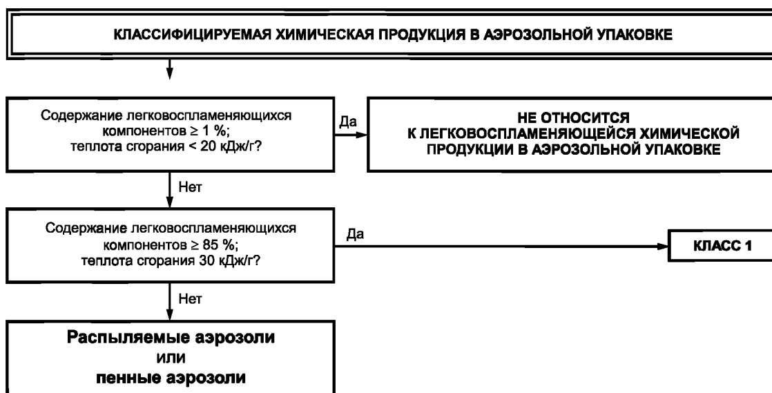
Рисунок 1 — Общая процедура классификации химической продукции в аэрозольной упаковке

Процедуры классификации опасности химической продукции в аэрозольной упаковке представлены на рисунках 1 и 2.