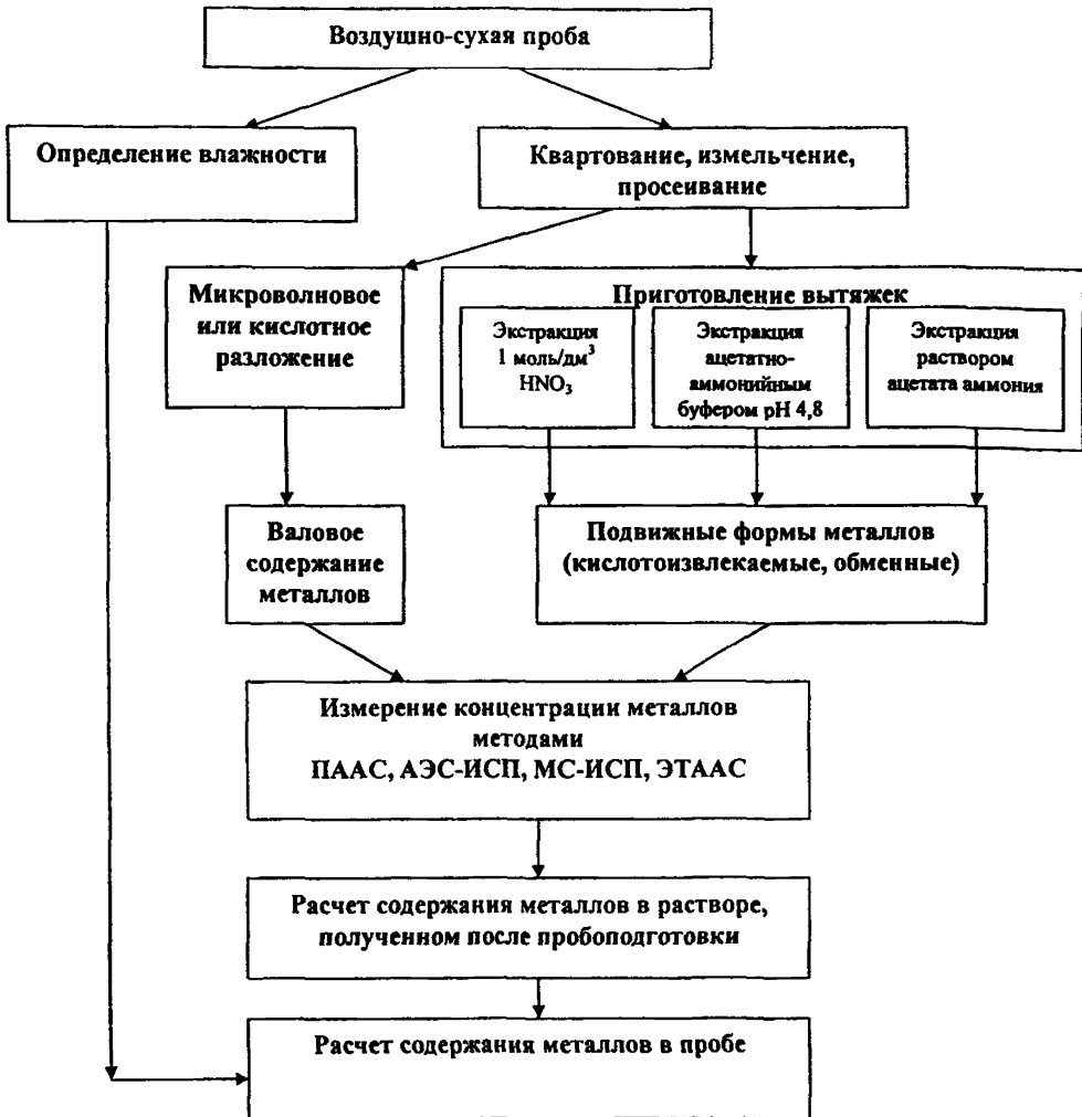
Схема выполнения анализа ОСВ на содержание металлов