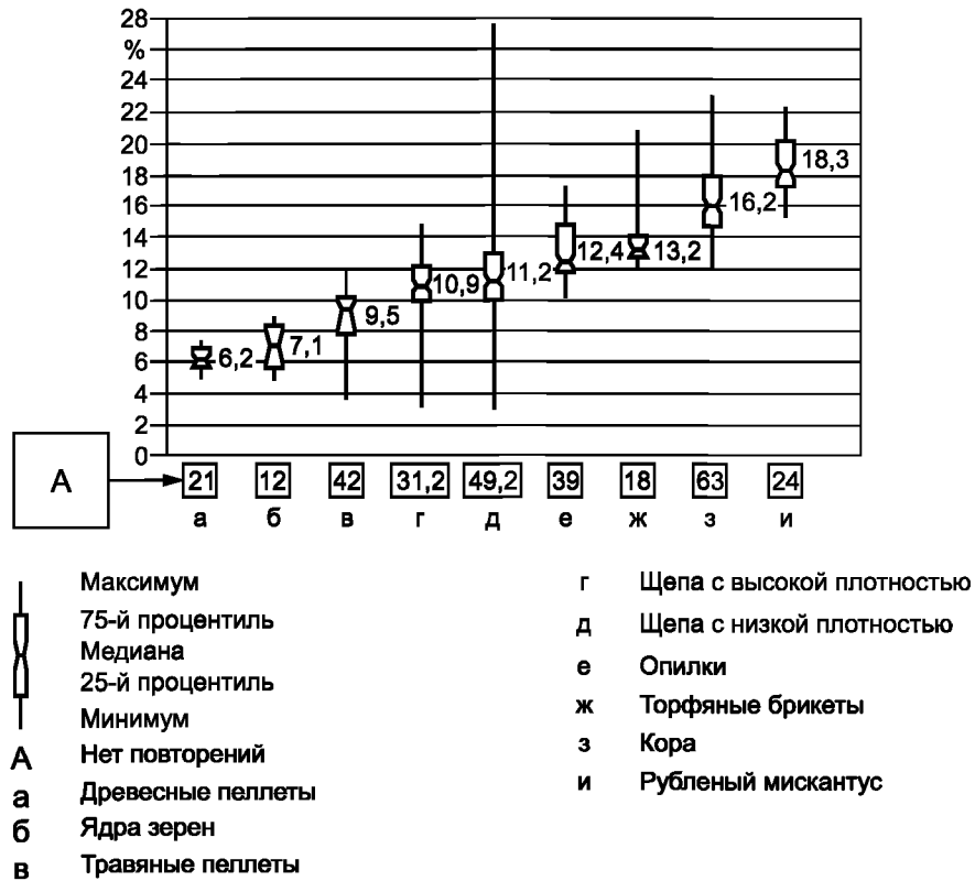
Рисунок А.1 — Относительное отклонение неударного применения

Относительное приращение определений насыпной плотности для твердого биотоплива. Применение метода с ударным воздействием в сравнении с безударным воздействием