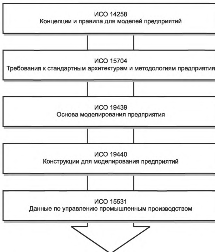
Рисунок 1 — Иерархия объектов стандартов в области моделирования архитектуры и интеграции предприятия

На рисунке 1 приведена иерархия объектов, описанных в основополагающих стандартах в области моделирования архитектуры и интеграции предприятия, определяющая последовательность изучения стандартов и их использования для целей моделирования предприятий. На рисунке 2