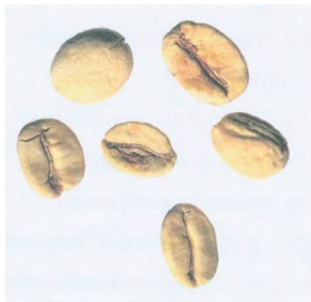
Рисунок С.20 — Белое зерно (см. 4.10)