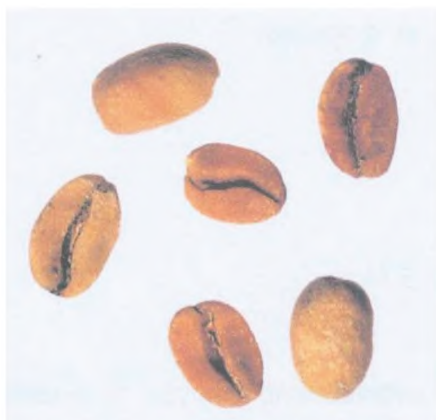
Рисунок С.13 — Коричневое зерно («ardido») (см. 4.3)