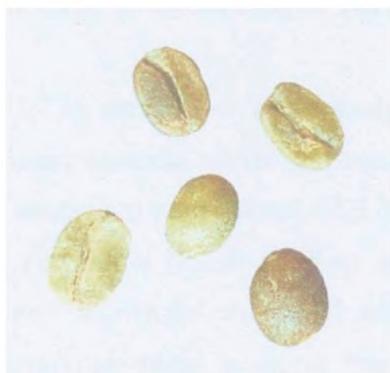
Рисунок С.15 — Незрелое зерно; неразвившееся зерно («quaker») (см. 4.5)