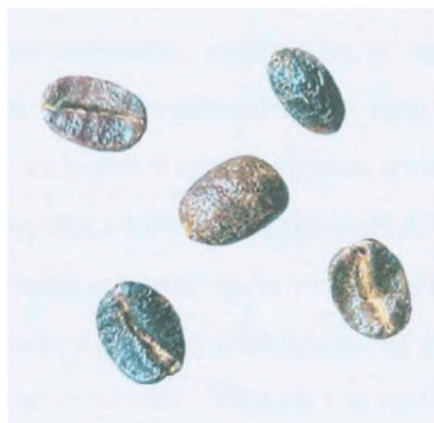
Рисунок С.12 — Черно-зеленое зерно (см. 4.2)