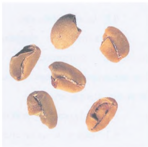
Рисунок С.8 — Ломаное зерно (см. 3.3)