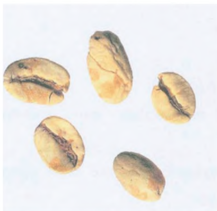
Рисунок С.19 — Губчатое зерно (см. 4.9)