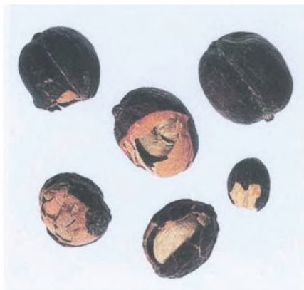
Рисунок С.3 — Сухой кофейный плод (см. 2.3)