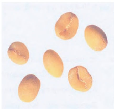
Рисунок С.14 — Янтарное зерно (см. 4.4)