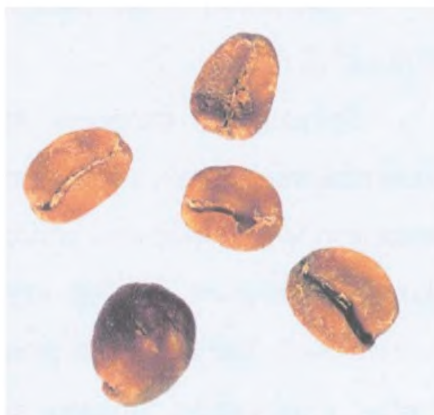
Рисунок С.16 — Восковидное зерно (см. 4.6)