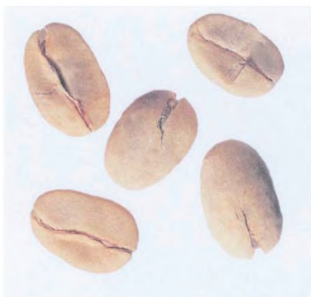
Рисунок С.1 — Зерно в пергаментной оболочке (см. 2.1)