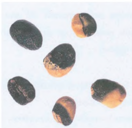
Рисунок С.11 — Черное зерно и частично черное зерно (см. 4.1)