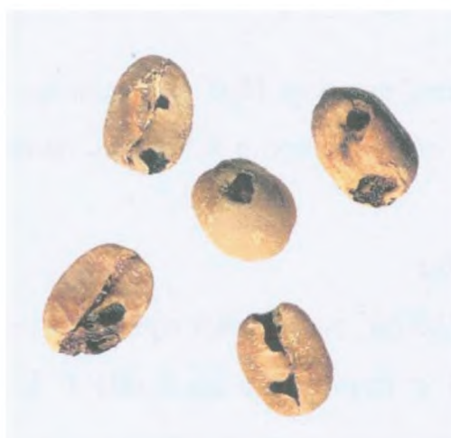
Рисунок С.9 — Зерно, поврежденное насекомыми (см. 3.4)