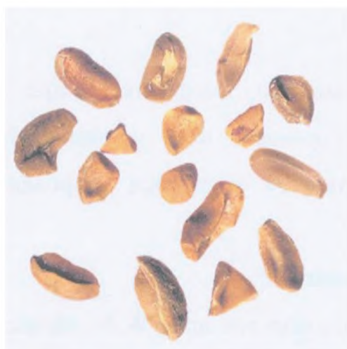
Рисунок С.7 — Обломки зерна (см. 3.2)