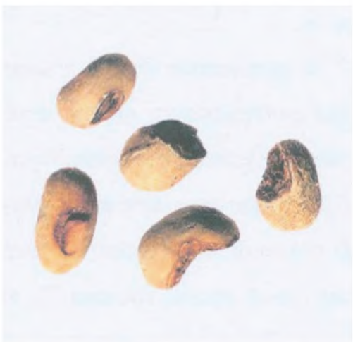
Рисунок С.10 — Зерно, поврежденное при пульпировании (см. 3.6)