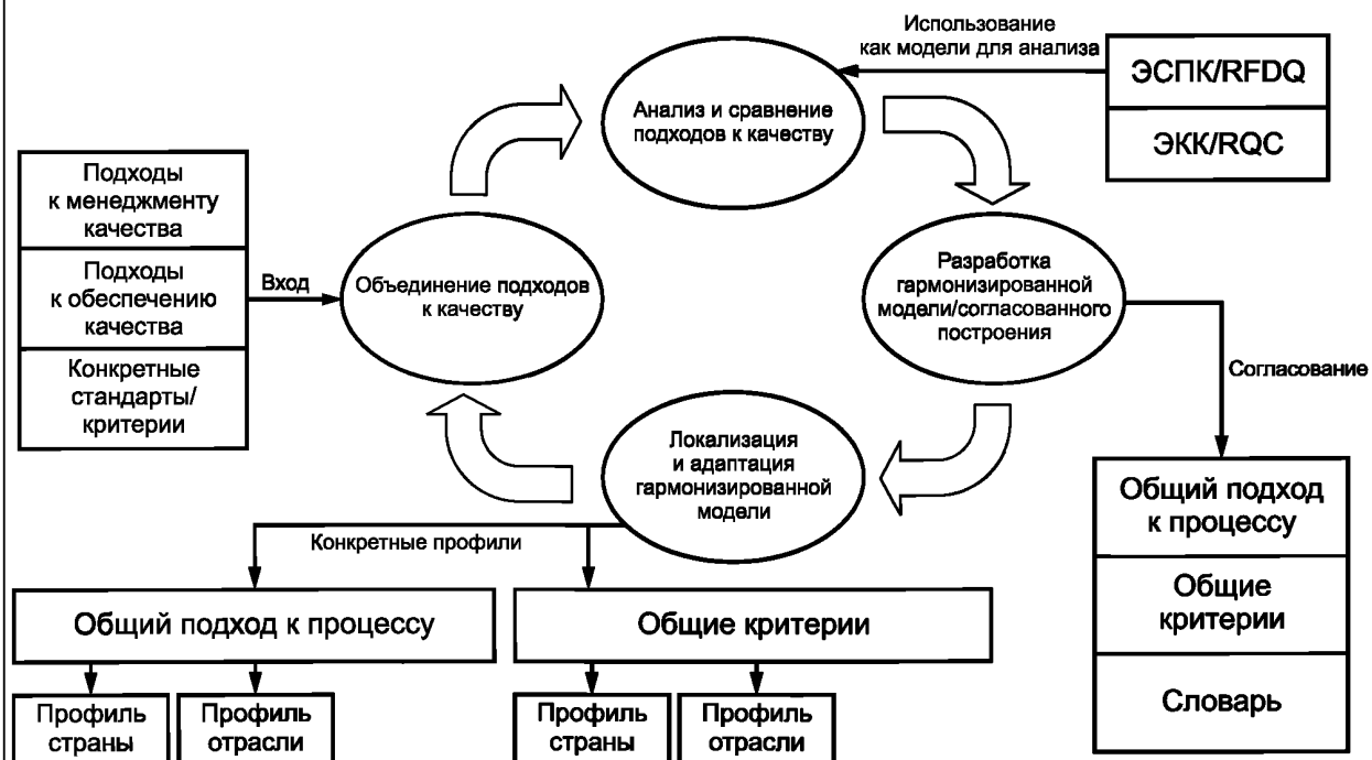
Рисунок ДА.1 — Схема разработки общего подхода к качеству в области электронного обучения

Схема разработки общего подхода к качеству в области электронного обучения приведена на рисунке ДА.1.