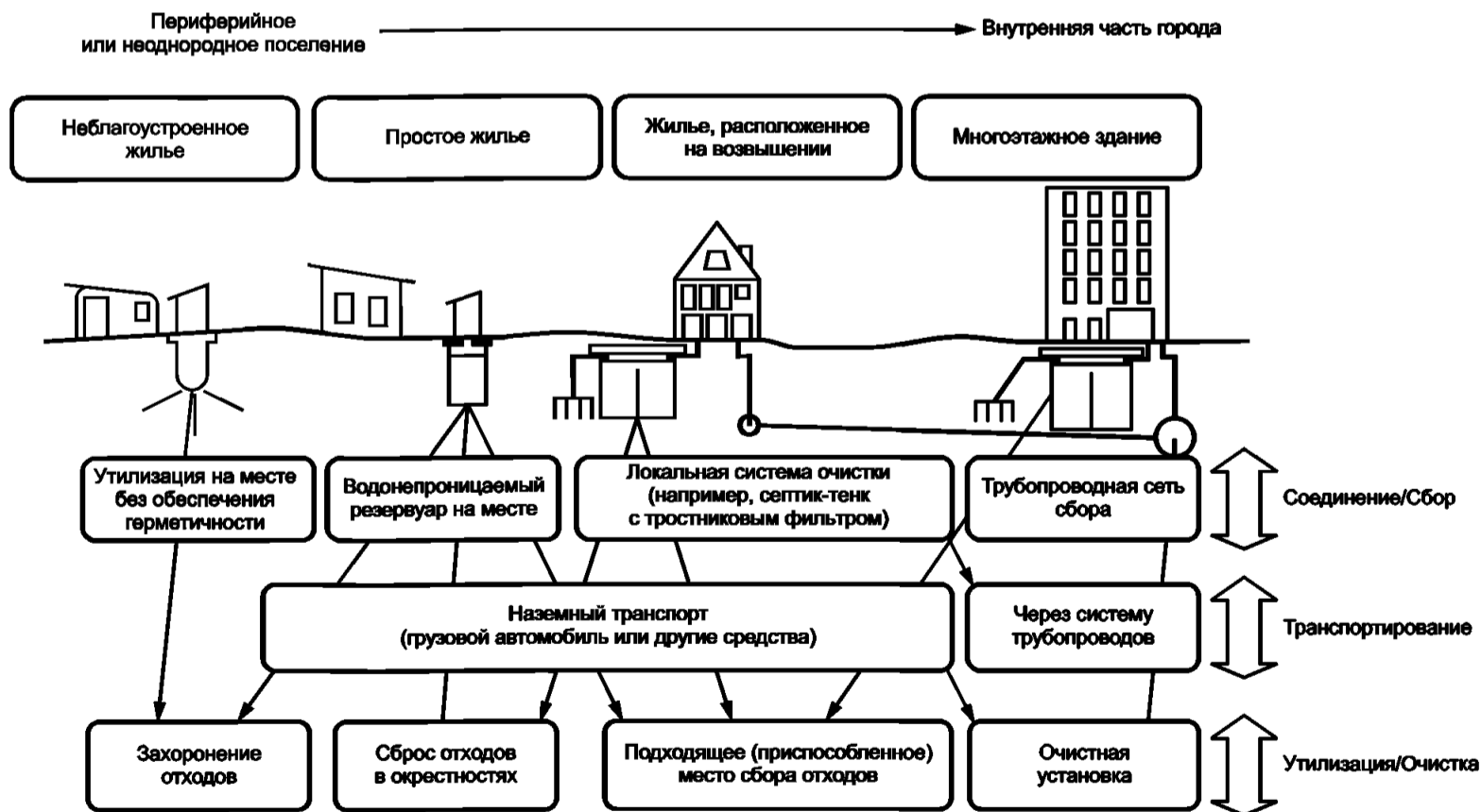
Рисунок В.2 — Типы систем удаления сточных вод