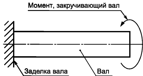
Рисунок 1 — Схема испытаний валов на прочность

Изделия считают прошедшими испытания на прочность, если после испытаний не обнаружено остаточной деформации узлов или деталей.