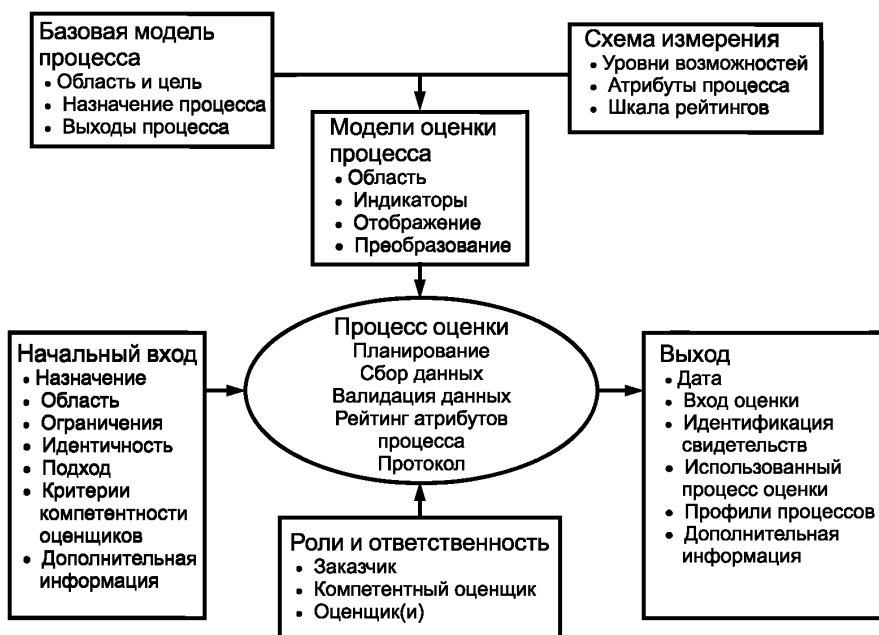
Рисунок 1 — Нормативные элементы настоящего стандарта

Примечание — Верхние уровни возможностей могут предоставить больше достоверной информации относительно ожидаемых бизнес-целей организации; нижние уровни возможностей могут указать потенциальные источники рисков.