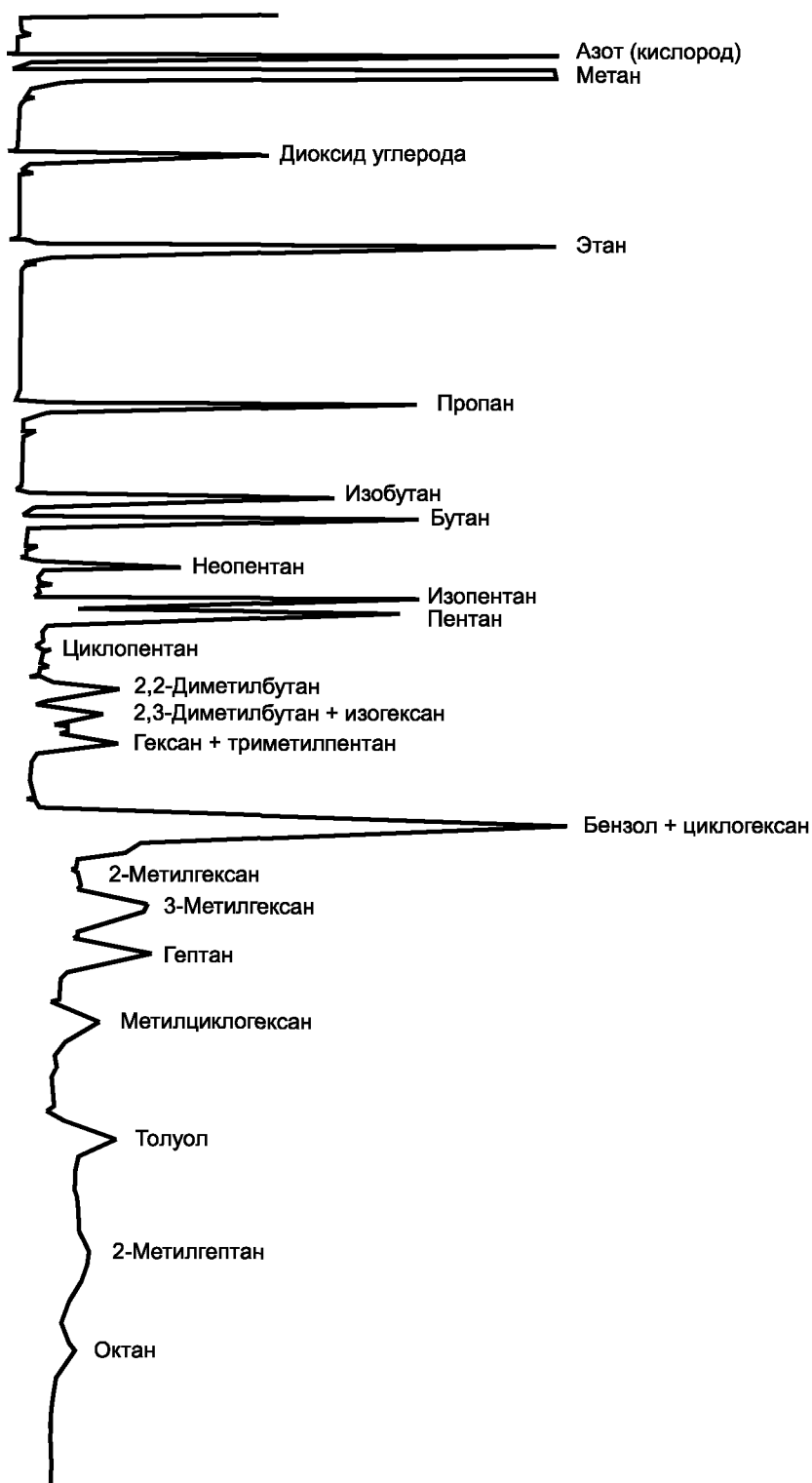
Рисунок А.2 — Типичная хроматограмма азота (кислорода), диоксида углерода и углеводородов от C 1 до C 8 на колонке с Porapak R