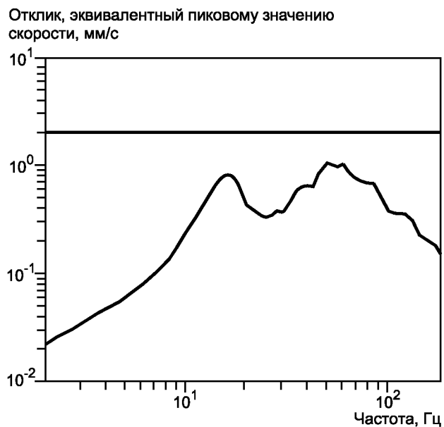
Рисунок А.3 — Найденное среднеквадратичное значение скорости

Согласно этапу а) процедуры, описанной в 4.2, определяют значение скорости, которое для данного примера равно 2 мм/с, — см. рисунок А.3