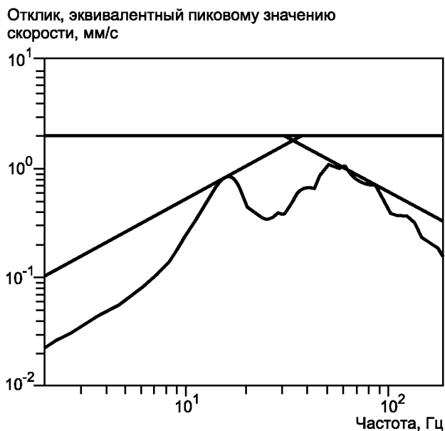
Рисунок А.4 — Линии постоянного перемещения и постоянного ускорения

После этого определяют положение линии постоянного перемещения [см. 4.2, перечисление б)], которое дает частоту перехода перемещения 38 Гц, и линии постоянного ускорения [см. 4.2, перечисление с)], которое дает частоту перехода ускорения 31 Гц, — см. рисунок А.4.