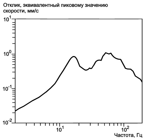
Рисунок А.2 — Спектр отклика

Спектр отклика, построенный по ИСО/ТС 10811-1 для Q = 10 , приведен на рисунке А.2.