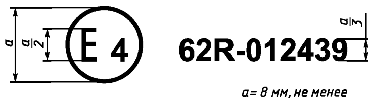
Образец А (См. 4.4 настоящих Правил)

Приведенный выше знак официального утверждения, проставленный на транспортном средстве, указывает, что этот тип транспортного средства официально утвержден в Нидерландах (Е4) в соответствии с Правилами ЕЭК ООН № 62 в отношении защиты транспортного средства от угона. Номер официального утверждения указывает на то, что официальное утверждение было предоставлено в соответствии с требованиями Правил ЕЭК ООН № 62 в их первоначальной форме.