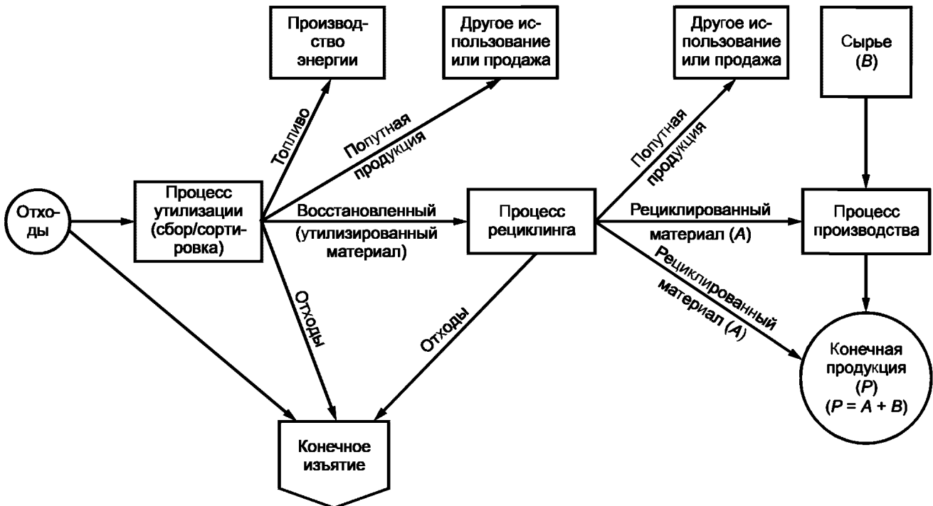
Рисунок А.1 — Упрощенная схема представления системы рециклинга

Доля рециклированного содержимого в продукции X\% = (A/P) \times 100 .