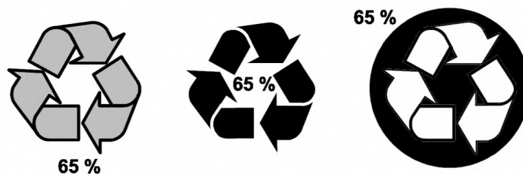
Рисунок 2 — Примеры допустимого размещения значения в процентах при использовании ленты Мебиуса

7.8.3.5 Используемый знак может сопровождаться идентификацией материала.