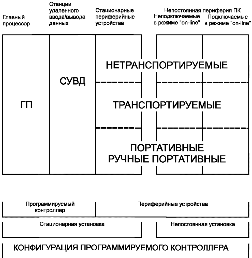
Рисунок А.1 — Конфигурация программируемого контроллера

На рисунке А.1 показана связь между определениями, относящимися к техническим средствам программируемых контроллеров.