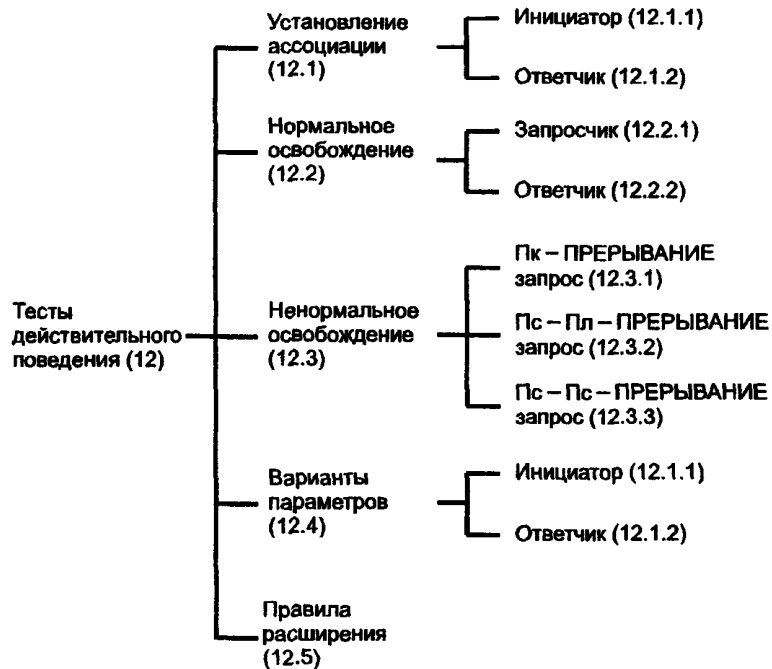
Рисунок 2 — Тесты действительного поведения СЭУА