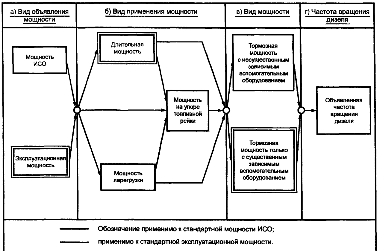
Рисунок 1 — Диаграмма, показывающая способы обозначения мощности

Способы обозначения мощности дизеля в соответствии с перечислениями а , б и в приведены на рисунке 1. Термины, используемые в указанных перечислениях, можно комбинировать, например: длительная тормозная мощность на упоре топливной рейки.