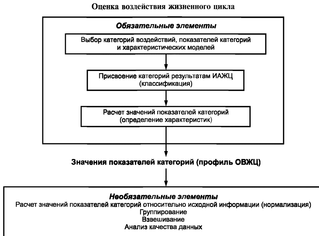
Рисунок 1 — Элементы фазы ОВЖЦ

4.3.2 К обязательным элементам ОВЖЦ относят: