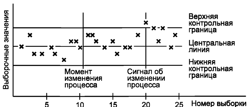
Рисунок 1 — Пример применения контрольной карты для случая, когда длина серии выборок равна 10 выборкам между моментом изменения процесса и сигналом об его изменении

значение промежутка времени, в течение которого КК не покажет, что процесс вышел из управляемого состояния. Причем, иногда фактическая длина серии выборок может быть больше или меньше ARL .