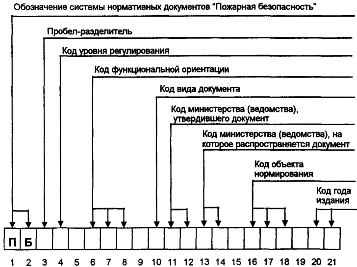
Рис. 1. Структура кодов нормативных документов по пожарной безопасности

1.2. Каждый класс (подкласс) обозначают цифровым кодом. Совокупность кодов, записанная в определенной последовательности, образует код нормативного документа (рис.1).